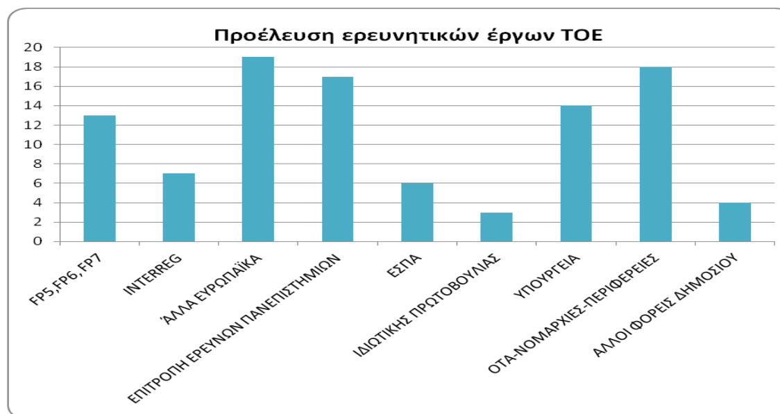
Διάγραμμα 4: Προέλευση ερευνητικών έργων του ΤΟΕ

Στους πίνακες 1 και 2 αναφέρονται αναλυτικά τα ερευνητικά προγράμματα των μελών ΔΕΠ του ΤΟΕ της περιόδου 2004-2014 . Επίσης στον πίνακα 2 αναφέρεται η σημαντική ερευνητική δραστηριότητα των μελών ΔΕΠ του ΤΟΕ που έχουν αποχωρήσει από το Τμήμα, λόγω μετακίνησης σε άλλο Τμήμα ή συνταξιοδότησης. Ενδεικτικά οι συμμετοχές των μελών ΔΕΠ του ΤΟΕ σε ερευνητικά προγράμματα αναφέρονται ακολούθως