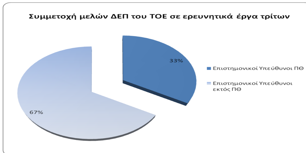
Διάγραμμα 3: Διάρθρωση συμμετοχής μελών ΔΕΠ του ΤΟΕ σε ερευνητικά έργα επιστημονικών υπευθύνων άλλων φορέων υποδοχής

Συνολικά, τα μέλη ΔΕΠ του ΤΟΕ έχουν συντονίσει ή έχουν συμμετάσχει σε διάφορα ερευνητικά έργα, συμπεριλαμβανομένων ευρωπαϊκών αλλά κι εθνικών, δημόσιων ή ιδιωτικών πρωτοβουλιών (Διάγραμμα 4 )